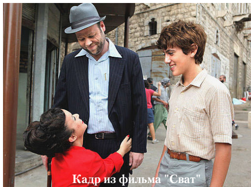
Кадр из фильма "Сват"