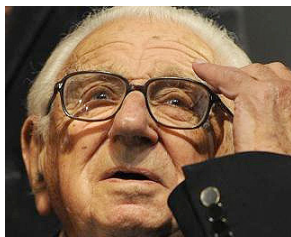
Николас Джордж Уинтон

1 июля в возрасте 106 лет в Великобритании скончался сэр Николас Джордж Уинтон – человек, перед началом Второй мировой войны спасший около 700 еврейских детей из Чехословакии.