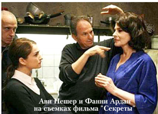
Ави Нешер и Фанни Ардан на съемках фильма "Секреты"

С 2008-го по 2010-й год Ави Нешер был награжден премиями международных кинофестивалей в Иерусалиме и Хайфе; получил престижную премию Ландау в сфере искусств; удостоился звезды на