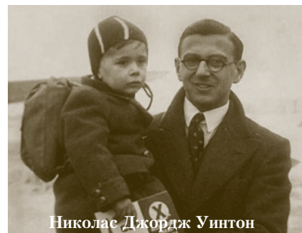
Николас Джордж Уинтон