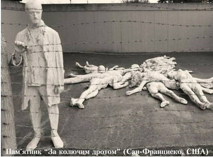
Пам'ятник "За колючим дротом" (Сан-Франциско, США)

Україна на державному рівні приєдналася до відзначення цієї міжнародної дати у 2012 році (постанова Верховної Ради