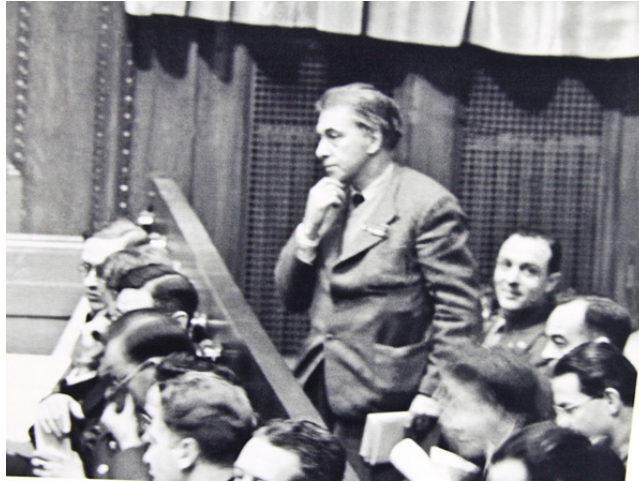
Илья Эренбург на Нюрнбергском процессе

И еще раз этот сын Давидов поставит жизнь на кон. В 1942 г. Эренбург становится членом ЕАК – Еврейского антифашистского комитета. И начинает собирать документы для "Черной книги" – свидетельства о Холокосте. Но в 1948 г. из-за конф-