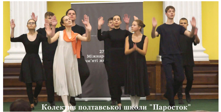
Колектив полтавської школи "Паросток"