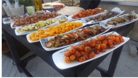
Обед на базе ЦАХАЛа.

— Обязательно суп. Несколько видов салатов. Этим израильская армия тоже отличается: мало где еще можно увидеть такое разнообразие салатов. Поскольку в Израиле и на гражданке люди едят много овощей, то и в армии это непре-