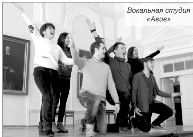
Вокальная студия «Авив»

Ежегодный Фестиваль еврейской культуры им. Шолом-Алейхема – одно из самых ярких событий в культурной жизни не только еврейской общины Чернигова, но и всего города. Все годы своего существования (а в этом году Фестиваль проводится уже в 13-й раз!) Фестиваль еврейской культуры им. Шолом-Алейхема дарит черниговцам встречу с еврейской культурой прошлого и настоящего в самых разных формах и направлениях: выставки