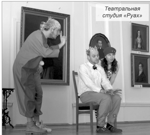
Театральная студия «Руах»