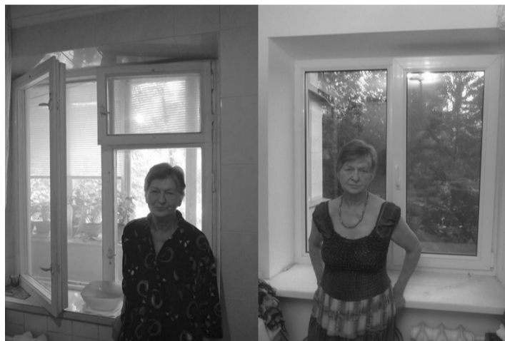
До... и после ремонта

Вот уже несколько лет в Киеве и Киевской области пожилым малоимущим евреям делает ремонты Фонд «Для тебя». На сегодняшний день более 200 семей смогли убедиться в том, что это реальная помощь, которая оказывается совершенно безвозмездно. Безусловно, средства ограничены, у фонда нет возможности полностью отремонтировать квартиру и помочь всем нуждающимся, но фонд продолжает изыскивать новые средства для помощи тем, кому это необходимо. Например, замена окон и новые откосы. Сразу становится теплее и светлее, нет проблем с открыванием и закрыванием. Многим знакомо чувство страха из-за неровного пола и дырок в линолеуме, пожилой человек опасается лишний раз пройти из комнаты в кухню. И совершенно потрясающее ощущение, когда твой старый пол вновь ровный и безопасный. Ночные страхи из-за того, что старую дверь можно открыть ногтем, тоже легко и быстро устраняются. Такие ремонты не только делают жизнь комфортней они ме-