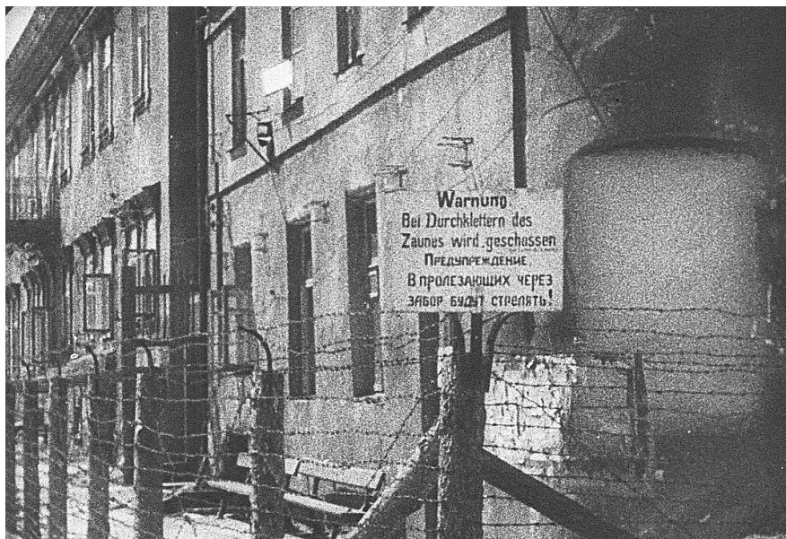
Такая ограда отделяла Минское гетто от остальной части города.