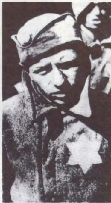
Еврей-красноармеец в плену

В годы прибытия в страну большой алии приезжали бывшие фронтовики - раненые воины со своими семьями. Тщательные проверки достоверности документов, представленных для установления инвалидности, затягивали решения комиссии следователей при министерстве финансов на долгие месяцы. Если раненого выхаживали в советских госпиталях, то запросы сомневающимся следователей отправлялись в Центральный медицинский архив в Лазаретном переулке Ленинграда. Когда же уцелевший в бою, но раненый оказывался на оккупированной территории или в плену, к полученным справкам относились с подозрением. Шла многомесячная переписка с советскими и зарубеж-