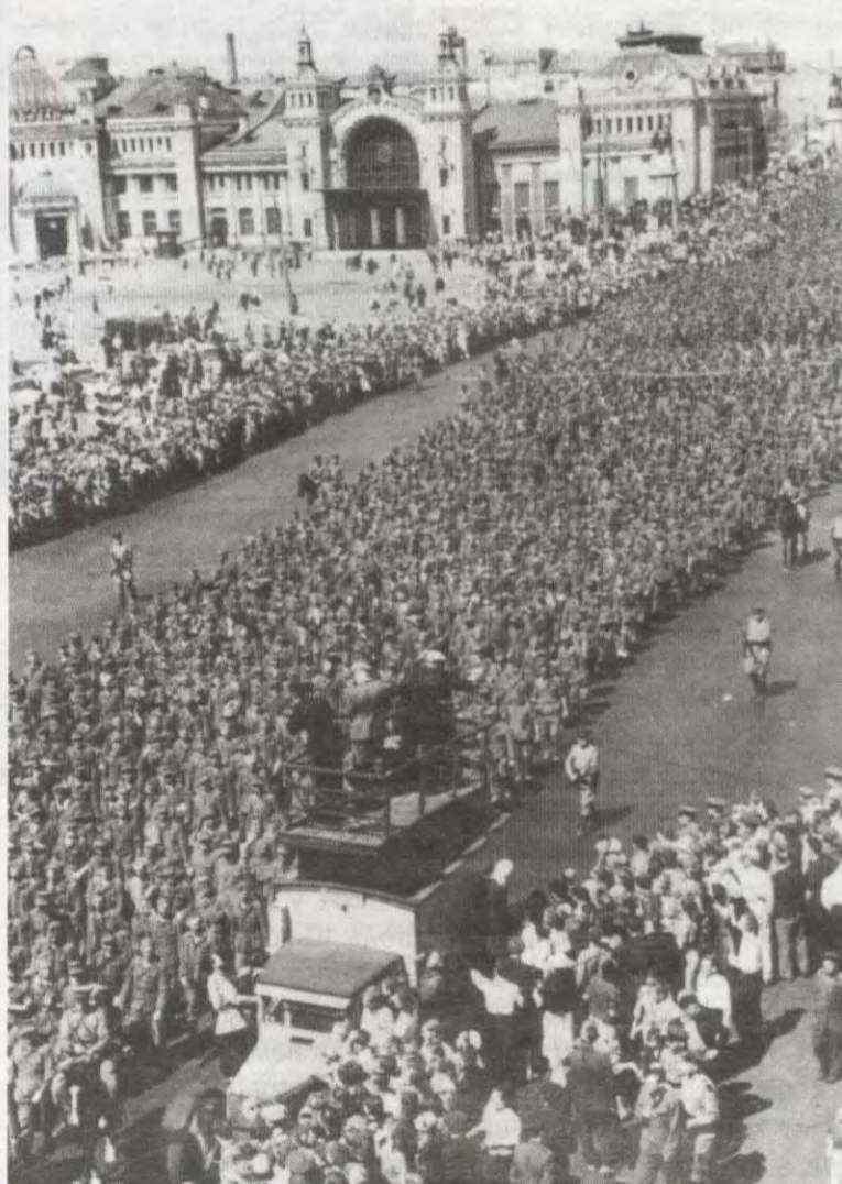
«Марш побежденных» в Москве

(ул. Горького, площадь Маяковского и др.) наблюдали марш тех, кто хотел хозяйничать на этих улицах. В руках некоторых москвичей были плакаты с надписями на русском и немецком языках: «Смерть фашизму!», «Сволочи, чтоб они подошли», «Почему вас не