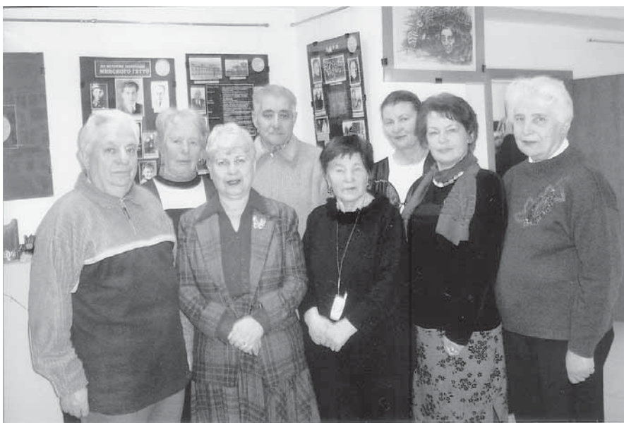
На встрече детей подпольщиков в музее истории и культуры евреев Беларуси.