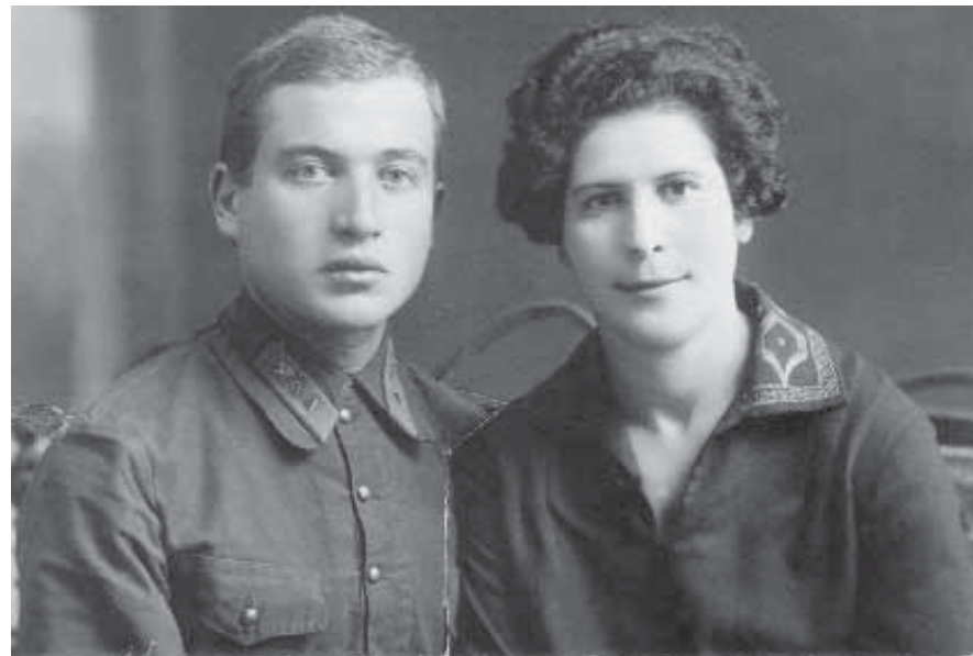
Мама и папа в день бракосочетания.