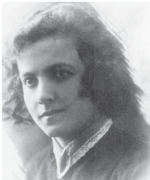
Сестра отца Сарра.