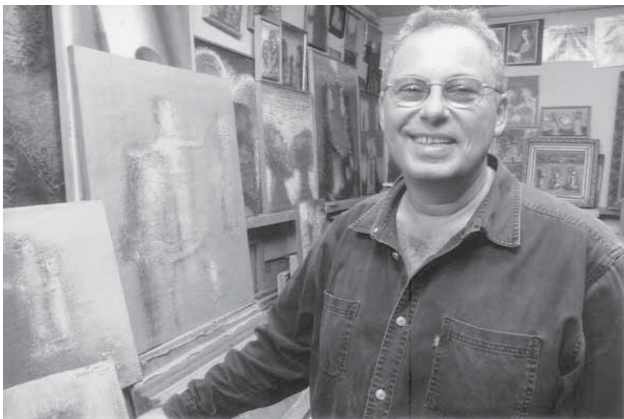
Художник Матвей Басов.