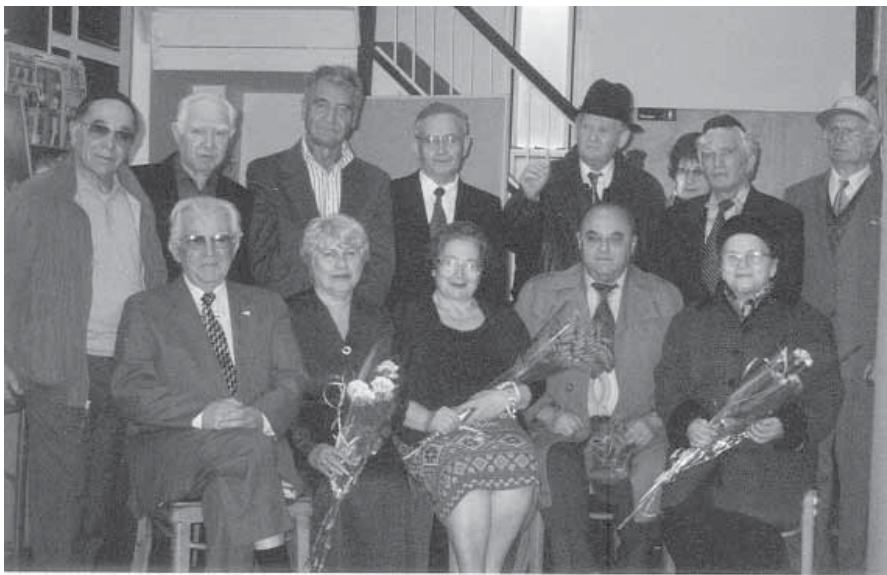
После митинга "Марш живых" в Нью-Йорке.