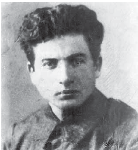
Михаил Гебелев.