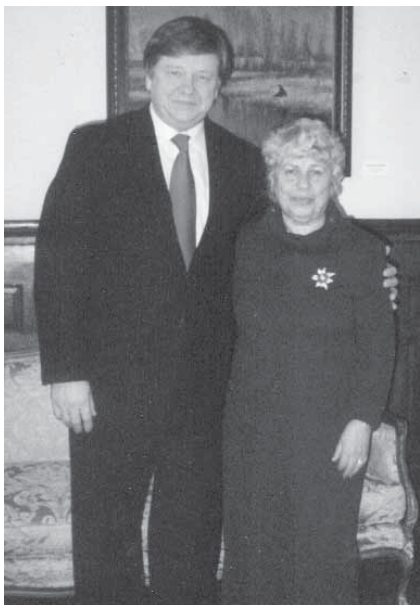
Светлана Гебелева с послом РБ в США М.М. Хвостовым.