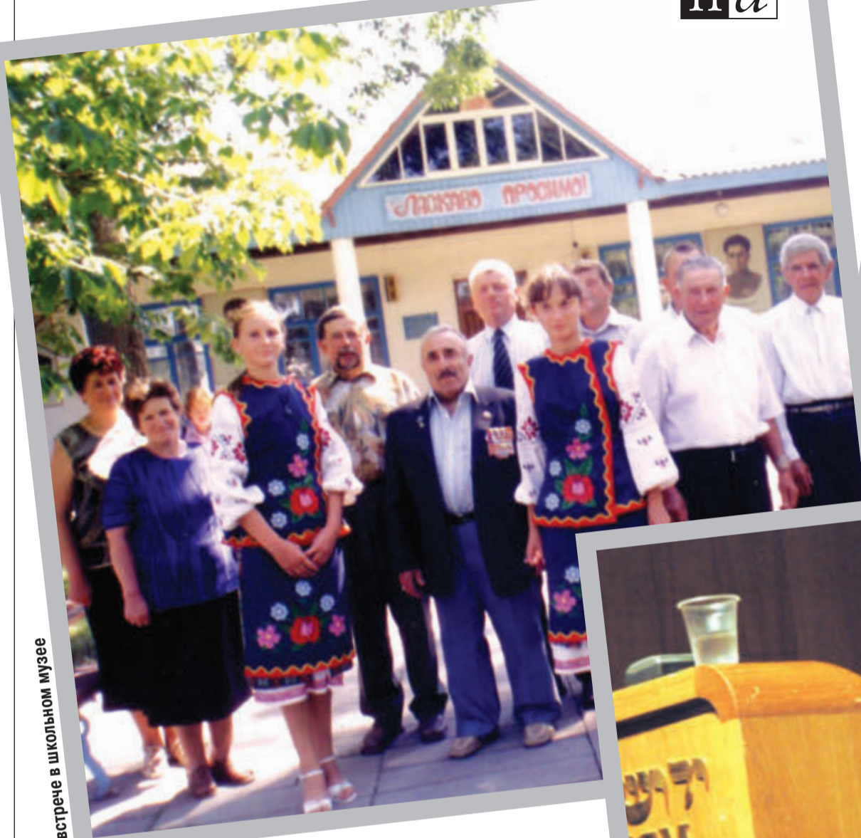
На встрече в школьном музее