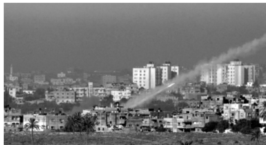
Террористы в секторе Газа запускают очередную ракету по израильским городам, используя палестинский густо заселенный район

Попробуем взглянуть на итоги операции более широко. ХАМАС усилил влияние и, как считают некоторые аналитики, приобрел своего рода легитимность в глазах мирового сообщества. «Братья-мусульмане» в Египте показали, что могут ставить прагматические соображения выше идеологии. А президент США Барак Обама, к нескрываемой радости Нетаньяху, показал, что, несмотря на некоторые разногласия, его администрация остается всецело на стороне Израиля.