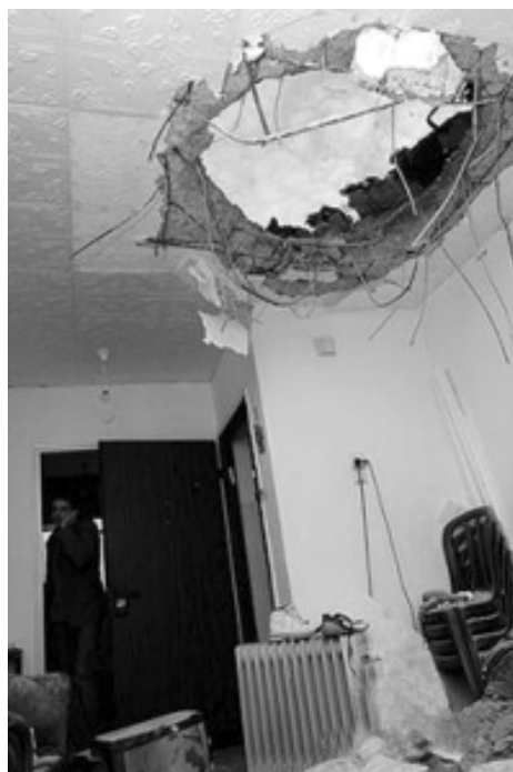
Квартира в Сдероте после ракетного обстрела

рен, что Израиль должен, воспользовавшись возможностью, полностью зачистить сектор Газа, не считаясь с ценой и возможными последствиями.