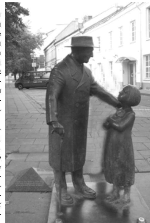
Памятник доктору Айболиту