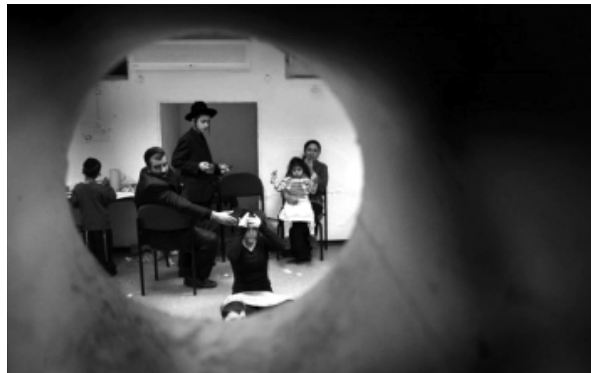
Еврейская семья в бомбоубежище

Взрыв автобуса в центре Тель-Авива разбудил воспоминания о достаточно недавнем и еще более страшном прошлом. Вряд ли этот теракт пошатнул убежденность тех, кто был уве-