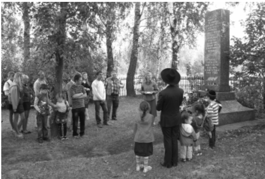
Перед началом встречи

В первый день Песаха, 2 апреля 1942 года, обитателей гетто расстреляли у противотанкового рва. Группами по 200 и более человек гитлеровцы выводили евреев к противотанковому рву, раздевали догола, а затем расстреливали из пулеметов и автоматов. Многих детей бросали в ров живыми и закапывали вместе с расстрелянными. Некоторым детям ударом о колено переламывали позвоночник, руки, ноги».