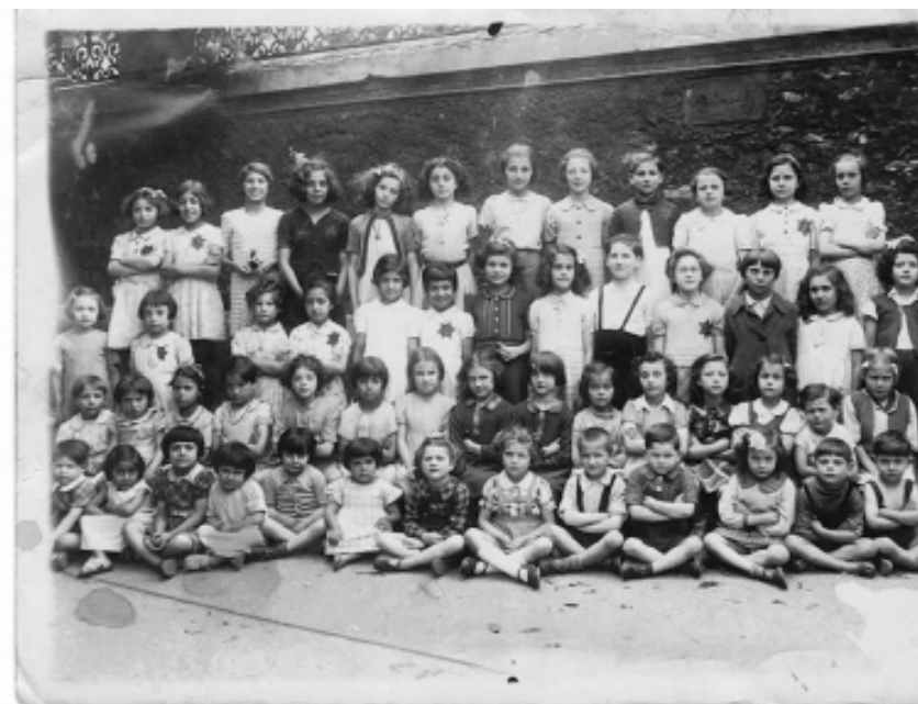
Учащиеся начальных классов школы на rue Poullétier, Париж, июль-август 1942 г. На многих детях видны позорные звезды.

В мае 1942 г. каждый еврейский ребенок в возрасте старше 6 лет был обязан носить на одежде желтую шестиугольную звезду с надписью «Еврей». Детям евреев было запрещено посещать парки, театры, ездить в детские лагеря.