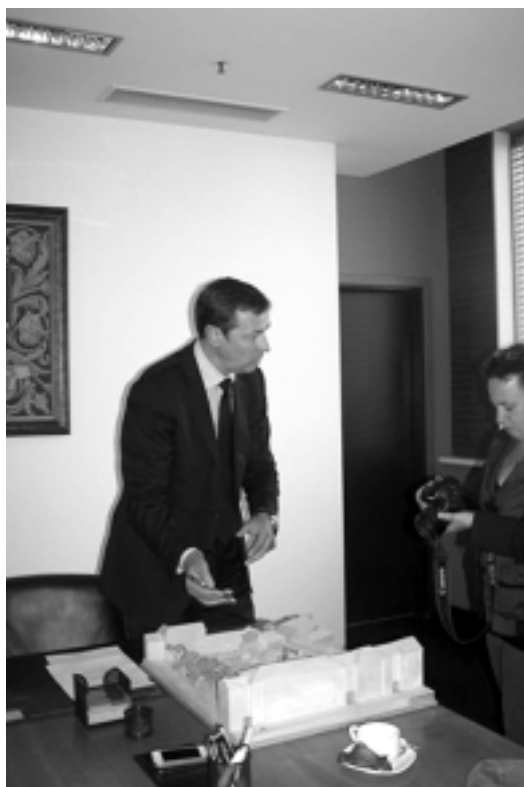
Мэр Вильнюса Артурас Зуокас

вшем здании КГБ мы увидели высеченные на камне имена людей, замученных в здешних застенках, и имена эти были самые разные: литовские, русские, еврейские... Для нас, между тем, было важным также узнать, как Литва, в течение столетий бывшая одним из важнейших центров еврейской жизни Европы, пытается возродить сегодня и еврейскую общину, и еврейское наследие страны и вернуть себе, соответственно, внимание еврейского мира.