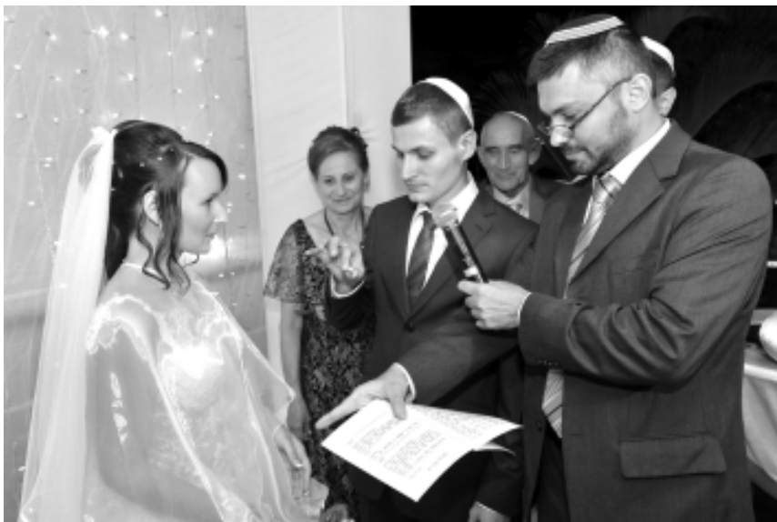
Церемония бракосочетания под хупой.

внезапно перебросили в ту часть, где служил Гилад Шалит, в бронетанковую. И надо было поддерживать там ребят, их настрой. Помню, как эти мальчишки сумели собраться и побороть свои тревоги после похищения Гилада. И они шли на задания с одной целью: спасти, вытащить товарища. (Не их вина, что не получилось). Это были тяжелые дни для всех нас. Помню, я тогда почти не бывал дома – столько было работы с личным составом. Обычно командиры советуются с раввином – поскольку он лучше других офицеров знает личностные особенности многих солдат.