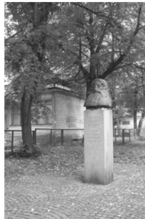
Памятник Виленскому гаону на месте, где была Большая синагога

Далее литовский премьер признался, что одна из самых популярных книг в его стране сегодня – это книга об Израиле