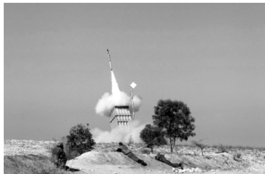
Израильская система ПРО запускает ракеты земля-воздух на перехват палестинских ракет

Добились ли Барак и Нетанияху успеха? Это покажут ближайшие недели и месяцы. Но многие аналитики отмечают, что ХАМАС и другие радикальные террористы не будут долго сидеть сложа руки. Другие, впрочем, указывают, что на севере Израиля после окончания Второй ливанской войны 2006 года до сих пор сохраняется относительно стабильная и спокойная ситуация.