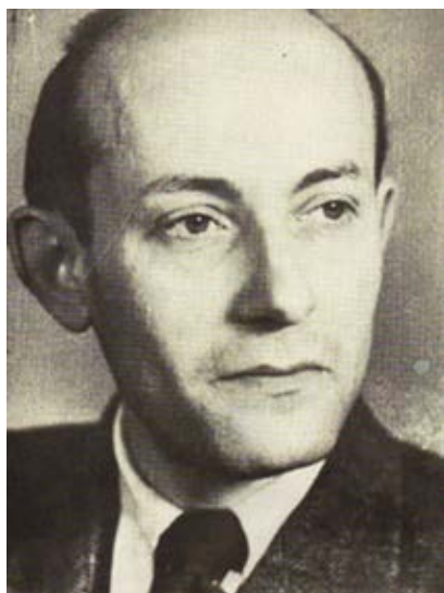
Хайнц Галинский (1912- 1992)