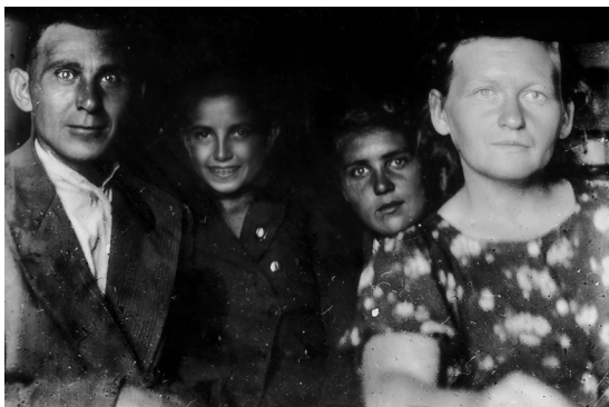
Минск. Детдом №12. Середина августа 1945 года.