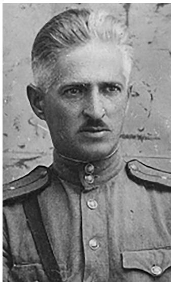
Отец. 1944 год

время после начала движения, когда колонна подверглась сильному артиллерийскому обстрелу. У отца была рация и он сообщил на свою базу, что приблизительно, в таком-то районе, колонну обстреливает немецкая артиллерия. В этот момент один из снарядов угодил в борт танка. Отец потерял сознание.