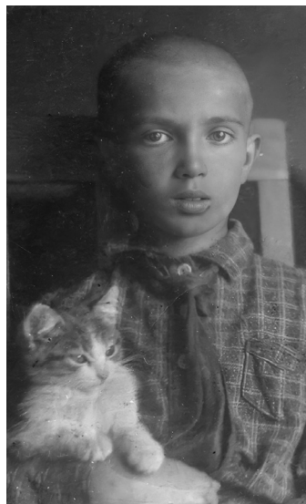
Июнь. Ошмяны. 1941 год. Я с кошкой Муськой

А на завтра, тихим воскресным утром 22 июня 1941 года наш городок Ошмяны, небольшой районный центр Западной Белоруссии в предвоенные годы, проснулся от грохота бомбовых разрывов. Был разрушен дрожжевой завод, повреждено здание райкома партии и сожжено несколько жилых домов.