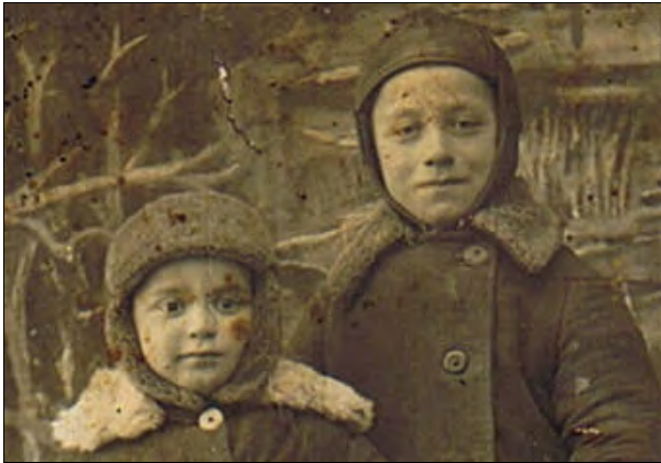
, 1940 .